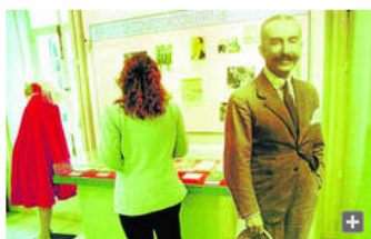
Una imagen de la exposición que se podía ver en la antigua sede de la Fundación, la casa donde vivió Muñoz Seca en la calle Nevería.